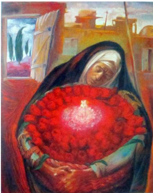
تصویر ۲- چشم نرگس به شقایق نگران خواهد شد. کاظم چلیپا، ۱۳۶۳

از جمله مواردی که می‌توان به آن به عنوان عنصر یا عناصر سازنده‌ی هنر انقلاب اسلامی اشاره کرد که به نوعی با عنصر نماد در ارتباط می‌باشد؛ استفاده از عناصر و الگوهای کهن(سستی) است که در آثار هنری این دوره حضور جدی دارد. هنرمندان انقلاب با به کار بردن این عناصر در آثار خود، یک تجربه‌ی نو را در آثار خود آزمودند و جایگاه ویژه‌ای را در هنرهای دوره‌ی معاصر به خود اختصاص دادند. به طور مثال، خزائی، حضور عناصر نگارگری در نقاشی و پوسترها را شاهد این ادعا می‌داند. در بسیاری از این پوسترها، حضور نقش درخت سرو(تصویر ۲)، هاله نوری نقوش تزئینی(تصویر ۳) و ... همگی برگرفته از عناصر نقاشی ایرانی با مفهوم نمادین نویی منطبق با مبادی هنرهای تجسمی ارائه شده‌اند(خزائی، ۱۳۹۲: ۲).