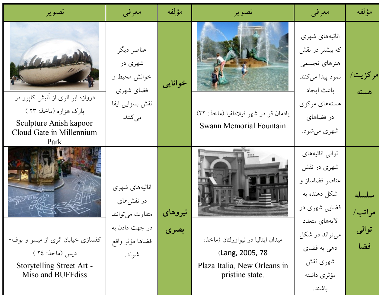
جدول ۲. مؤلفه‌های زیبایی‌شناختی فضا

اثاثیه و مبلمان شهری از لوازم کاربردی و بعضا غیر کاربردی در فضاهای شهری به شمار می‌روند. ولیکن نحوه طراحی آنها می‌تواند به گونه‌ای باشد که در ترکیب با فضا نقش زیبایی‌شناختی محیط را دو چندان کند. نظریات بررسی شده در رابطه با مولفه‌های کیفی فضاهای شهری، مؤلفه‌هایی را مطرح ساخت که تطبیق این مؤلفه‌ها با اثاثیه‌های شهری می‌تواند در ایجاد فضاهای شهری مطلوب کمک شایانی کند. طبق جدول ۱، این مؤلفه‌ها عبارتند از: ویژگی‌های فضایی شامل مؤلفه‌های مرکزیت، هسته، سلسله مراتب، توالی فضا، نیروهای بصری. مولفه‌های فرمی شامل: هارمونی و ریتم، پیچیدگی و ویژگی‌های تجربی شامل مقیاس انسانی، پیاده‌مداری و سرزندگی، هویت و اصالت و معنی. استقرار اثاثیه‌ها در فضاهای شهری، می‌تواند با بهره‌گیری از مؤلفه‌های زیبایی‌شناسی تاثیر گذار بر طراحی شهری به جهت تقویت فضاهای شهر و عجين شدن آن با زندگی روزمره مردم صورت پذیرد. در جمع‌بندی نمونه‌هایی از اثاثیه شهری ارائه شده که در به وجود آمدن فضاهای شهری مطلوب به کار گرفته شده‌اند. به عنوان مثال قرارگیری اثر در موقعیتهای مرکزی نظیر میداين، تکرار و ریتم آنها در راسته‌های محوری، و متناسب با ضرباهنگ فضا می‌تواند محیط را به لحاظ فضای تجربی دگرگون سازد. (جدول ۲).