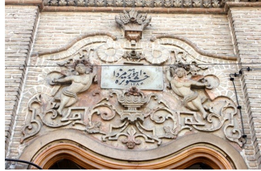
تصویر ۷. کتیبه سردر وردی مدرسه فیروزبهرام در خیابان سی تیر - تهران