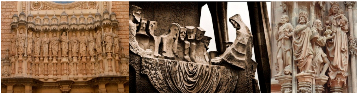
تصویر ۱۳. بخشی از نمای یک بازلیکا در بارسلون (ماخذ: ۳۳).

عناصر هنر تجسمی می توانند به واسطه روایت رویدادهای تاریخی، مذهبی و اسطوره ای جوامع محلی موجب پیوند اجتماعی مردم شوند. نظیر کتیبه کلیسای جامع استراسبورگ ۹ در فرانسه، که سه مجوس ایرانی را در حال تقدیم هدیه به حضرت مریم به خاطر تولد حضرت مسیح نشان می دهد.