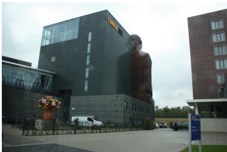
تصویر ۱. ساختمان موزه جسم در هلند از نمای پشتی

این نگاه به طراحی حجم و فرم کلی بنا به معماری وجهی تندیسگون می دهد، و در بسیاری از مواردی که به ویژه در یکی دو دهه اخیر طراحی شده است، طرح شماییلی استفاده شده در بنا رابطه ای با موضوع کارکردی و شخصیتی اثر برقرار نمی نماید. ولیکن بنا به واسطه طراحی تندیسگون خود فارغ از زمینه شهری وجهی شاخص، متمایز و به یاد ماندنی می یابد. از معمارانی چون اِرو سارینن ۱ ، اریک مندلسون ۲ ، یورن اوتزن ۳ و در پایان قرن بیستم و از افرادی چون سانتیاگو کالاتراوا ۴ در دهه های اخیر با چنین گرایشی می توان نام برد.