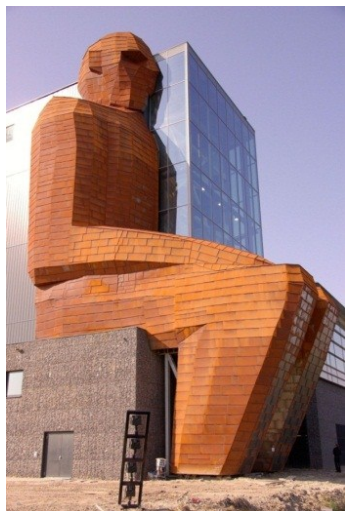
تصویر ۲. ساختمان موزه جسم در هلند (ماخذ: ۳۴)

یا طراحی فرم کلی کلیسای رنشان به کمک شمایل حضرت مریم و مسیح.