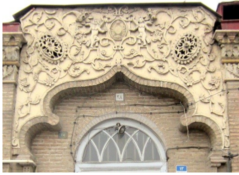
تصویر ۸. نمای خانه ای مسکونی در بافت شهری - خیابان جمهوری تهران