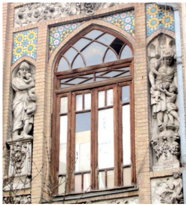
تصویر ۹ و ۱۰ - نمای بدنه پاساژی در خیابان ناصر خسرو تهران