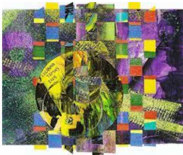
شکل ۳ نمونه ای دیگر از تصویرگری به روش کلاژ