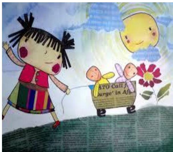
شکل ۴: نمونه ای از تصویرگری به روش کلاژ