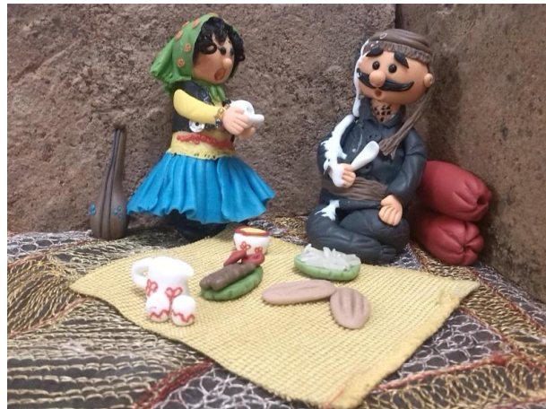
شکل ۶: تصویرگری عروسکی با خمیر، (داستانی)

در شکل های ۶ تا ۹ نمونه هایی از کاراکترها و عروسک های درست شده با خمیر و تصاویر خلق شده آورده شده است. در این نوع تصویرگری تمامی فضای تصویر و کاراکترها با خمیر و سایر اشیای طبیعی درست شده اند تا تصویر حالت واقعی تری نسبت به سایر روش ها داشته باشد. تصویرگری های فانتزی به دلیل زیبایی طنزگونه، جذابیت و تاثیرپذیری بیشتری در کودکان و خردسالان و حتی نوجوانان دارد (۵ و ۶). اگر در این تصاویر دقت نمایید فانتزی بودن طنزگونه ی کاراکترها، سه بعدی بودن، عمق بالا و کیفیت آن بخوبی مشهود می باشد. به عنوان مثال سایه کاراکترها بصورت کاملا طبیعی بوده و زیبایی و جذابیت بالایی به تصاویر داده است. به عنوان مثال شکل ۶ داستانی را روایت می کند که دختری شیطان در یک خانه روستایی کردنشین بدلیل تعریف های مهمان از او، هل می شود و سطل ماست را روی مهمان می ریزد. تصویر خلق شده کاملا منطبق بر داستان بوده و کل داستان را در یک تصویر برای کودک توضیح می دهد. یا در در شکل ۸ تصویر فضای یک کوچه روستایی با لباس ها و سنت های قدیمی را نشان می دهد و تصویر زیبا و ماندگاری را در ذهن کودک حک می کند. و همچنین در شکل ۹ برای نشان دادن اینکه تقلب در امتحان عمل پسندیده ای نیست طبق داستان این تصویر تاثیرپذیری زیادی را روی مخاطب گذاشته و معنی تقلب را در ذهن او حک می کند.