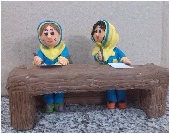
شکل ۹: تصویرگری عروسکی با خمیر، (داستانی)