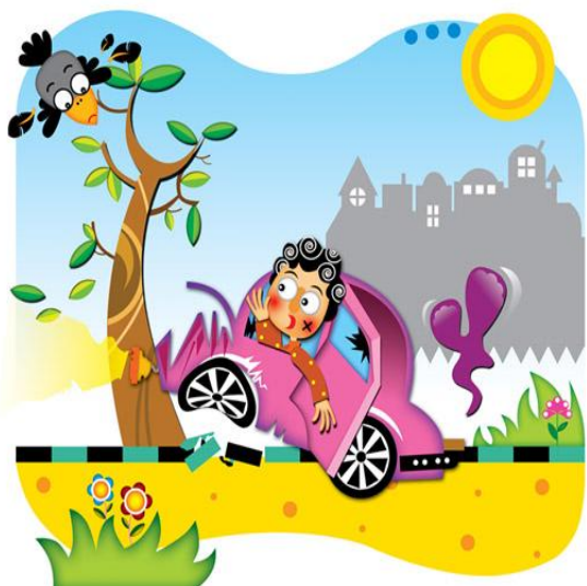
شکل ۱: نمونه ای از تصویرگری ۲ بعدی با روش نقاشی

در این بخش از پژوهش نمونه هایی از تصویرگری های ۲ بعدی با نقاشی، تصویرگری کلاژ و تصویرگری عروسکی از نظر عمق، کیفیت و جذابیت بیشتر مقایسه شده است.