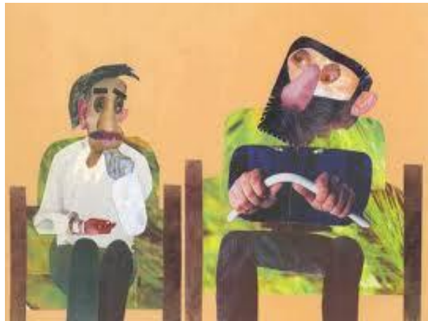
شکل ۲: نمونه ای از تصویرگری به روش کلاژ

در شکل های ۲ تا ۵ نمونه هایی از تصویرگری به روش کلاژ را مشاهده می کنید، در این نوع تصویرگری برخلاف روش نقاشی در شکل ۱، در بخشی از تصویر از اجسام طبیعی استفاده شده است تا تصویر به واقعیت نزدیکتر شود. بعنوان مثال در شکل ۲ از بعضی از اعضای صورت و بدن انسان در تصویر استفاده شده است. و جلوه ای نزدیکتر به واقعیت را به تصویر داده است. در شکل ۳ نیز در پس زمینه ی تصویر از پارچه استفاده شده است که نسبت به تصویرگری با نقاشی، تصویر عمیق تری با پس زمینه جذابتر بوجود آورده است. در شکل ۴ نیز در بخشی از نقاشی، روزنامه استفاده شده است که همانند اشکال ۲ و ۳ عمق و طبیعی جلوه دادن بخشی از تصویر واضح می باشد همچنین در شکل ۵ در لباس کاراکتر داستانی از پارچه به عنوان لباس محلی استفاده شده است که علیرغم عمیق شدن تصویر باز هم بدلیل رنگ نامناسب پارچه و همچنین نقاشی بودن بخش زیادی از تصویر، از جذابیت های آن کاسته شده است. در نتیجه می توان با روش های دیگری، عمق و کیفیت تصاویر را چندین برابر بهبود بخشید [۱ و ۶]. لذا در این پژوهش روشی تقریباً نوپا معرفی شده و به روش علمی مقایسه ای، به آن نگاه و روی آن بحث شده است. در شکل های بعدی جهت مقایسه نمونه هایی از تصویرگری عروسکی در دو کتاب تصویرگری شده به این روش، آورده شده است.