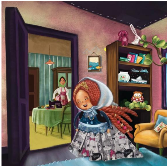
شکل ۵: نمونه ای از تصویرگری به روش کلاژ

در شکل های ۲ تا ۵ نمونه هایی از تصویرگری به روش کلاژ را مشاهده می کنید، در این نوع تصویرگری برخلاف روش نقاشی در شکل ۱، در بخشی از تصویر از اجسام طبیعی استفاده شده است تا تصویر به واقعیت نزدیکتر شود. بعنوان مثال در شکل ۲ از بعضی از اعضای صورت و بدن انسان در تصویر استفاده شده است. و جلوه ای نزدیکتر به واقعیت را به تصویر داده است. در شکل ۳ نیز در پس زمینه ی تصویر از پارچه استفاده شده است که نسبت به تصویرگری با نقاشی، تصویر عمیق تری با پس زمینه جذابتر بوجود آورده است. در شکل ۴ نیز در بخشی از نقاشی، روزنامه استفاده شده است که همانند اشکال ۲ و ۳ عمق و طبیعی جلوه دادن بخشی از تصویر واضح می باشد همچنین در شکل ۵ در لباس کاراکتر داستانی از پارچه به عنوان لباس محلی استفاده شده است که علیرغم عمیق شدن تصویر باز هم بدلیل رنگ نامناسب پارچه و همچنین نقاشی بودن بخش زیادی از تصویر، از جذابیت های آن کاسته شده است. در نتیجه می توان با روش های دیگری، عمق و کیفیت تصاویر را چندین برابر بهبود بخشید [۱ و ۶]. لذا در این پژوهش روشی تقریباً نوپا معرفی شده و به روش علمی مقایسه ای، به آن نگاه و روی آن بحث شده است. در شکل های بعدی جهت مقایسه نمونه هایی از تصویرگری عروسکی در دو کتاب تصویرگری شده به این روش، آورده شده است.